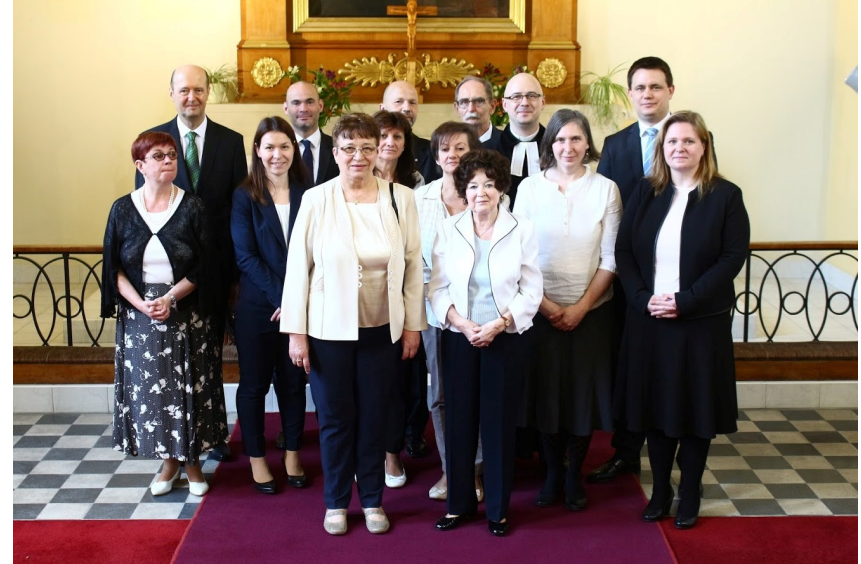
Gyülekezetünk új presbitériumának beiktatása 2018. április 22-én volt.

Egyházunkban gyülekezeti, egyházmegyei és egyházkerületi szinten tisztújításra került sor.